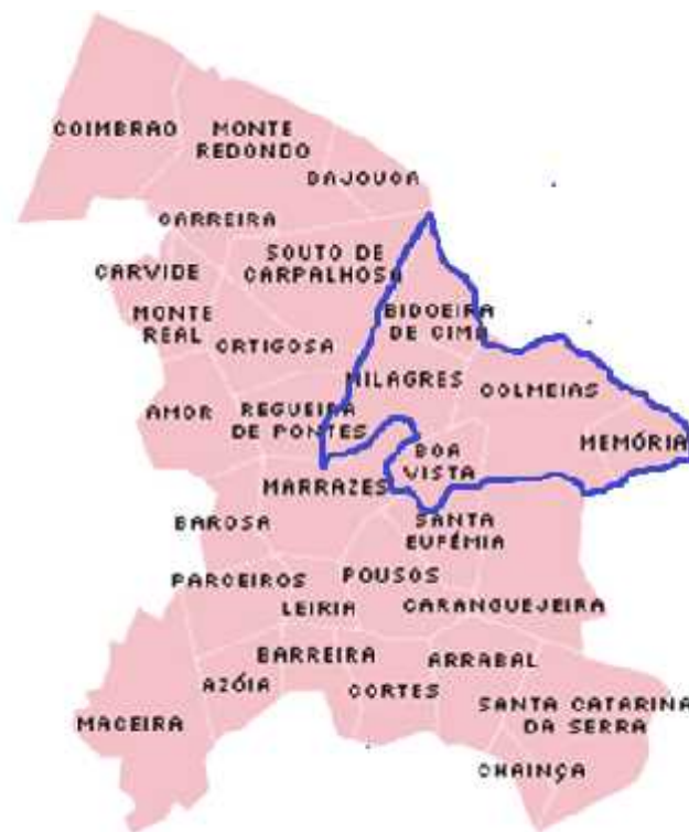
Freguesias do Concelho de Leiria