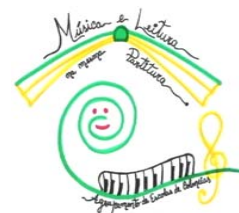
Logótipo do Projecto